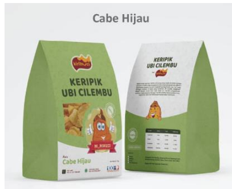
Gambar 16: Desain label kemasan KiriHuci varian rasa cabe hijau.