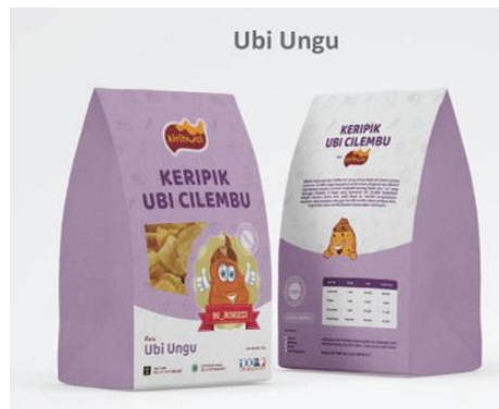
Gambar 17: Desain label kemasan KiriHuci varian rasa ubi ungu.