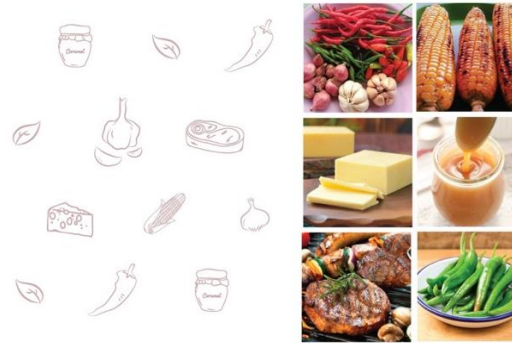
Gambar 9: Ilustrasi bahan-bahan dan bumbu Kirihuci yang digunakan sebagai pattern pada label belakang kemasan Kirihuci