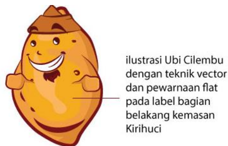
ilustrasi Ubi Cilembu dengan teknik vector dan pewarnaan flat pada label bagian belakang kemasan Kirihuci

Bentuk kakek yang digunakan untuk ilustrasi label kemasan Kirihuci bagian belakang diambil dari bentuk ubi Cilembu Sumedang, dengan blangkon khas Jawa Barat yang memiliki pengetahuan, wawasan, relasi yang luas dan juga memiliki kearifan dalam bertutur kata, tingkah laku, serta memiliki kesederhanaan dalam kehidupan.