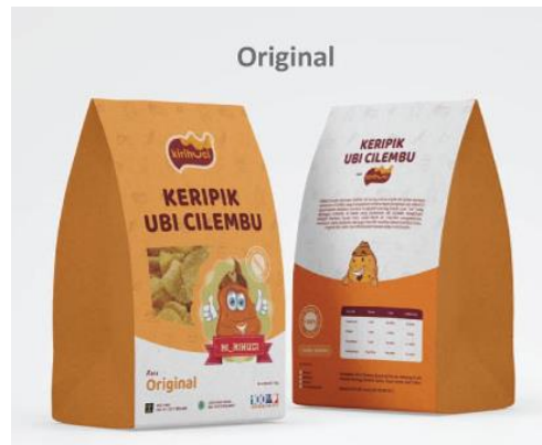
Gambar 13: Desain label kemasan Kirihuchi varian rasa original .

Berikut hasil akhir dari perancangan label kemasan dari sembilan varian rasa keripik Kirihuchi (original, balado, caramel, cabe hijau, ubi ungu, jagung bakar, keju, pedas, dan barbeque ) sesuai dengan standar Primary Display Panel pada kemasan: