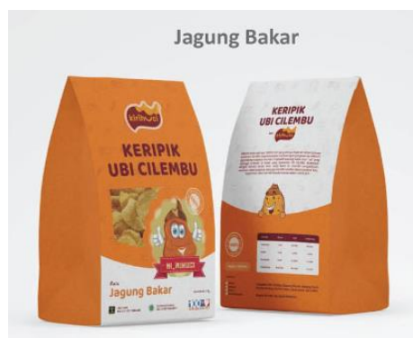
Gambar 18: Desain label kemasan KiriHuci varian rasa jagung bakar.