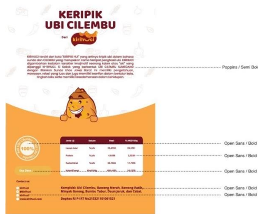
Gambar 5: Font yang digunakan pada kemasan tampak belakang Kirihuchi

Untuk filosofi mengenai logo Kirihuchi pada bagian belakang label kemasan menggunakan font Poppins- Semi Bold . Kemudian informasi produk seperti kandungan gizi, komposisi produk, tanggal kadaluarsa, jaminan bahan asli produk, kontak perusahaan, dan izin pemasaran produk menggunakan font Open Sans- Bold .