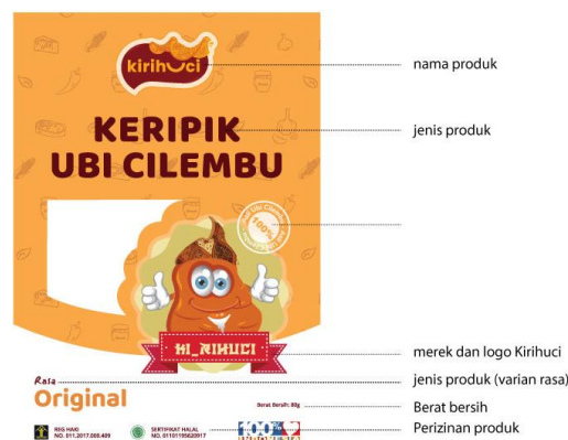
Gambar 11: Informasi produk pada label depan kemasan Kiriuhuci

Kemasan produk harus membuat informasi berupa nama produk, merek, logo, jenis produk, berat bersih, perizinan produk, tanggal kadaluarsa, komposisi, alamat dan keterangan produsen (Widiati, 2020). Informasi produk yang dijelaskan di atas sudah terdapat pada label depan dan belakang kemasan Kiriuhuci. Pada bagian belakang perancangan label kemasan Kiriuhuci terdapat informasi berupa nama produk, jenis produk, merek dan logo Kiriuhuci, varian rasa produk, berat bersih, dan perizinan produk.