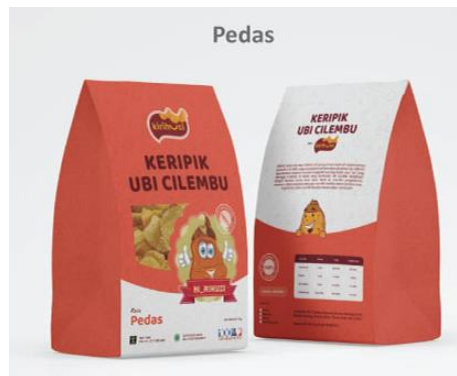
Gambar 20: Desain label kemasan Kirihuci varian rasa pedas.