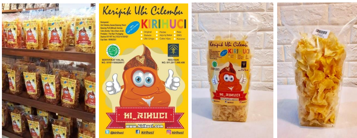
Gambar 1: Produk Kemasan Kirihuci Exisiting

puluh konsumen lainnya yang membeli produk lainnya beralasan karena mereka lebih tertarik dengan desain kemasan produk yang bagus dan tidak mudah hancur jika dibawa ke luar kota sebagai oleh-oleh. Selain mewawancarai konsumen, diskusi juga dilakukan dengan pemilik usaha untuk mengetahui kesulitan yang dihadapi dan kebutuhan mengenai kemasan produk ketika dipasarkan. Beberapa permasalahan yang dihadapi adalah keripik ubi Cilembu belum memiliki kemasan yang dapat melindungi keripik dengan baik karena masih menggunakan kemasan plastik transparan polos dengan label stiker sederhana, sehingga keripik rentan hancur jika produk ditumpuk ketika distribusi ke toko-toko. Berikut produk kemasan kirihuci Exisiting terera pada gambar 1, dibawah ini: