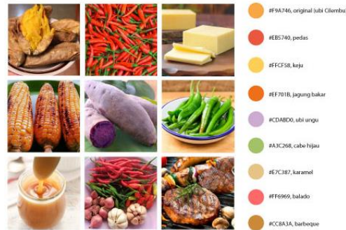
Gambar 3: Moodboard warna Kirihuci