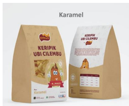
Gambar 15: Desain label kemasan Kirihuchi varian rasa karamel.