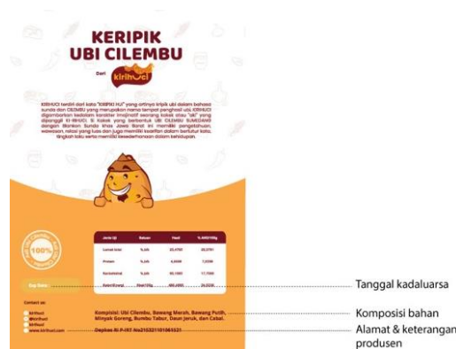
Gambar 12: Informasi produk pada label belakang kemasan Kiriuhuci (Sumber: Dokumentasi Pribadi, 2022)

Informasi berupa tanggal kadaluarsa, komposisi bahan, serta alamat dan kontak produsen terdapat pada bagian belakang desain label kemasan Kiriuhuci.