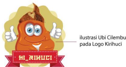
Gambar 6: Ilustrasi Ubi Cilembu pada Logo Kirihuchi yang digunakan pada label depan dan belakang Kemasan Kirihuchi

Gambar yang digunakan pada kemasan dapat menimbulkan kesan yang berbeda tergantung jenis fotografi atau ilustrasi yang dipilih. Desainer harus dapat memilih dan mengolah gambar fotografi atau ilustrasi yang tepat untuk digunakan pada media kemasan (Sekarlaranti Junaedi Shellyana, 2013).