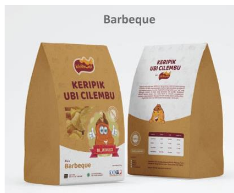
Gambar 21: Desain label kemasan Kirihuci varian rasa barbeque .

Setelah melakukan perancangan kemasan untuk memenuhi kebutuhan pelanggan dan keamanan produk kemasan, secara psikologis konsumen melihat kemasan produk Kirihuchi menjadi lebih berkualitas karena material kemasan