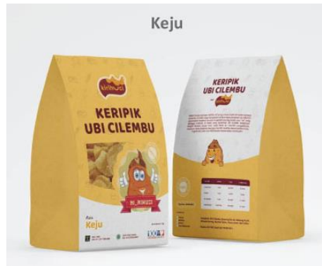
Gambar 19: Desain label kemasan Kirihuci varian rasa keju.