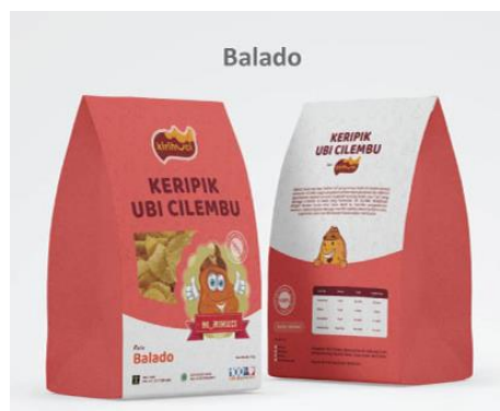
Gambar 14: Desain label kemasan Kirihuchi varian rasa balado.