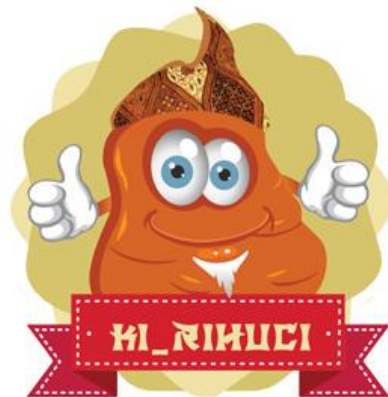
Gambar 2: Brand Kirihuci

Berikut brand dari Kirihuci yang digambarkan ke dalam karakter imajinatif seorang kakek atau “ aki ” yang dipanggil Ki-Rihuci (Hermawan, 2020).