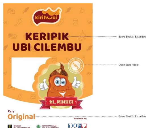
Gambar 4: Font yang digunakan pada kemasan tampak depan Kirihuci

Font pada perancangan label kemasan Kirihuci bagian depan yaitu Ballo Bhai 2- extra bold untuk informasi jenis dan varian produk. Informasi jaminan bahan baku asli keripik menggunakan font Open Sans- Bold .