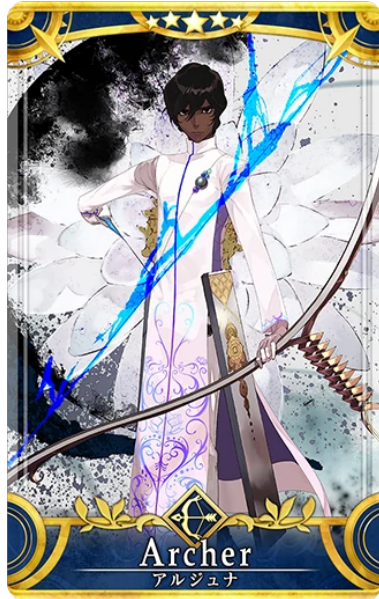
Gambar 2 Tampilan Arjuna Dalam Game

Berbeda dengan wayang orang yang menggunakan pakaian atau atribut tradisional, Arjuna dalam Game memiliki pakaian yang lebih simple dan terlihat modern untuk menarik minat pemain dan memiliki unsur kebaruan sebagai identitas Arjuna dalam Game Fate/Grand Order . Ada beberapa atribut yang dihilangkan seperti irah-irahan, sabuk cinde, sampur batik, endong. pengurangan atribut itu juga dilakukan agar mempermudah melakukan pergerakan berupa animasi agar tidak memerlukan banyak adegan dan animasi akan lebih mudah untuk dikerjakan. pakaian yang dikenakan Arjuna pada Game Fate/Grand Order merupakan pakaian Sherwani yang biasanya dipakai oleh bangsawan India dan memiliki lambang kemewahan dan strata sosial.