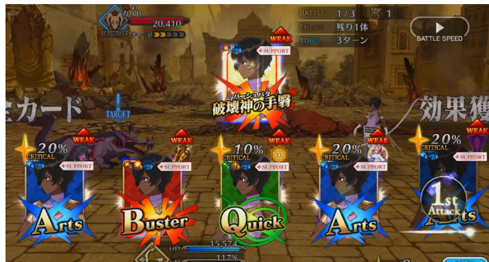
Gambar 4 Tampilan Arjuna Tingkatan Serangan