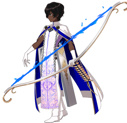
Gambar 3 Tampilan Arjuna Bersiap Dalam Game