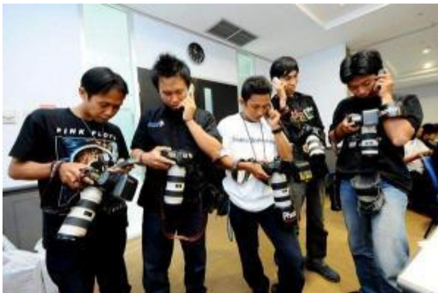
Gambar 5. Proses Hunting Foto

Dilihat sepintas, para pengguna lensa putih pada gambar diatas Nampak seperti fotografer yang faham mengenai kebutuhan lensa dan teknik memotret. Namun jika diperhatikan terdapat kesalahan pada penggunaan lensa. Dilihat dari ukurannya, lensa tersebut memiliki focal length antara 70-200mm, dalam hal ini lensa tersebut hanya cocok untuk kebutuhan pemotretan jarak jauh. Dan jika dilihat dari bentuk ruangan penggunaan lensa tersebut tidak akan optimal, karena ruangan tersebut tergolong sempit. Lebih lanjut jika kita perhatikan penggunaan aksesoris lampu flash yang digunakan secara direct shoot , maka fasilitas bukaan diafragma lensa yang mampu mencapai f. 4 – 2.8 akan sia-sia. Fungsionalitas lensa L Series yang dibuat sebagai lensa cepat tidak dimanfaatkan secara maksimal untuk menghasilkan gambar. Melainkan sekedar untuk menunjukkan gaya hidup penggunanya.