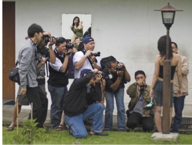
Gambar 3. Proses Hunting Foto

dapat mengaplikasikan kemampuan dalam mengambil gambar secara langsung dan juga sebagai ajang untuk memperlihatkan alat-alat fotografinya.