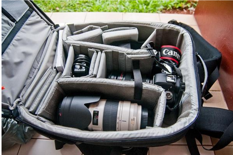
Gambar 2. Peralatan 'Canonian'

pun bermunculan. Komunitas fotografi terbentuk oleh berbagai latar belakang diantaranya kesamaan merk dan jenis kamera, kesamaan minat, kesamaan ide, ataupun kesamaan tujuan.