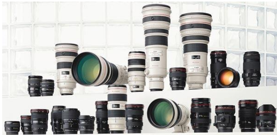
Gambar 1. Lensa L Series

dipasaran adalah warna hitam. Menurut pihak produsen, warna tersebut digunakan semata-mata untuk mengurangi efek panas yang lazim dialami oleh lensa yang berwarna hitam. Karena tidak seperti warna hitam, warna putih tidak menyerap cahaya matahari, sehingga tidak mudah panas. Hal tersebut bertujuan untuk membantu kerja fotografer yang menggunakannya pada sesi pemotretan yang dilakukan di luar ruang pada saat siang hari.