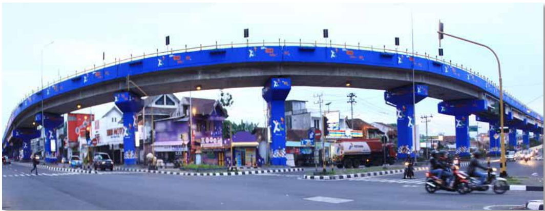
Gambar 3.7. Branding XL menjadi bagian pada elemen kota (XL Axiata, 2012)

Merupakan perusahaan penyedia layanan telekomunikasi yang agresif dalam memberikan pelayanan telekomunikasi berupa percakapan, sms, data dan pelayanan lainnya kepada masyarakat Indonesia. Salah satu dari beberapa kegiatan branding yang diambil XL untuk menciptakan visibilitas adalah dengan terus-menerus melakukan kegiatan branding permanen dengan melakukan pengecatan pada rumah, atap rumah, atau jembatan di daerah padat penduduk. Pada tahun 2011, XL telah mengecat atau wall painting hampir dua juta m 2 tembok bangunan di 150 kota di Indonesia. (XL Axiata, 2012)