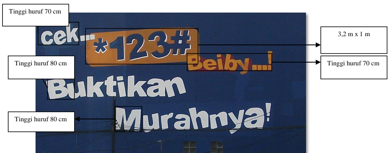
Gambar 4.20 Tipografi pada wall painting ‘XL’ (dokumen pribadi)

Satu elemen visual lain yang dikuatkan pada iklan wall painting XL, adalah nomor layanan XL “cek *123# Beiby..!”. Kode nomor ini kadang dibesarkan sejajar dengan penempatan yang berdampingan dengan logo. Kode layanan ini memiliki kekuatan yang sama dengan jargon, sehingga pada kondisi tertentu peneliti menemukan elemen visual wall painting yang hanya terdapat logo dan kode layanan tanpa adanya jargon. Kode layanan ini berisikan program promosi, pelayanan informasi dan berbagai layanan telekomunikasi yang ditawarkan secara suara kepada pelanggannya.