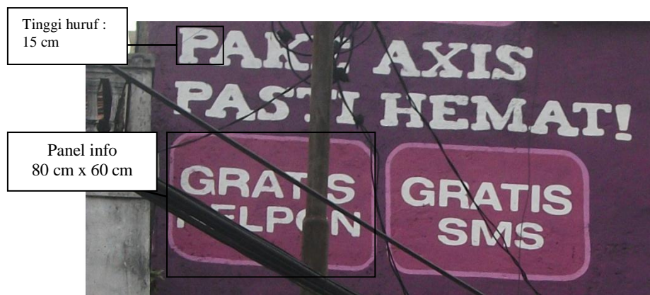
Gambar 4.29 Tipografi iklan Axis pada wall painting (dokumen pribadi)

sudut kanan atas pada bidang dinding, ditempatkan diatas latar belakang warna putih. Terdapat dua jenis bentuk layout yang digunakan oleh operator Axis dalam penelitian ini yaitu; layout baru dan layout lama. Keduanya memuat pesan yang sama namun berbeda pada tatanan grafisnya. Pada layout baru memperlihatkan bentuk kurva besar yang memisahkan bidang logo dan bidang informasi. Bidang informasi lebih memuat informasi dengan bentuk tiga buah kapsul yang tersusun pada bidang dasar ungu. Sementara pada layout lama menunjukkan empat buah persegi empat tumpul yang tersusun dengan berisi muatan informasi yang sama, namun pada informasi nomor pelayanan terpisah tersendiri.