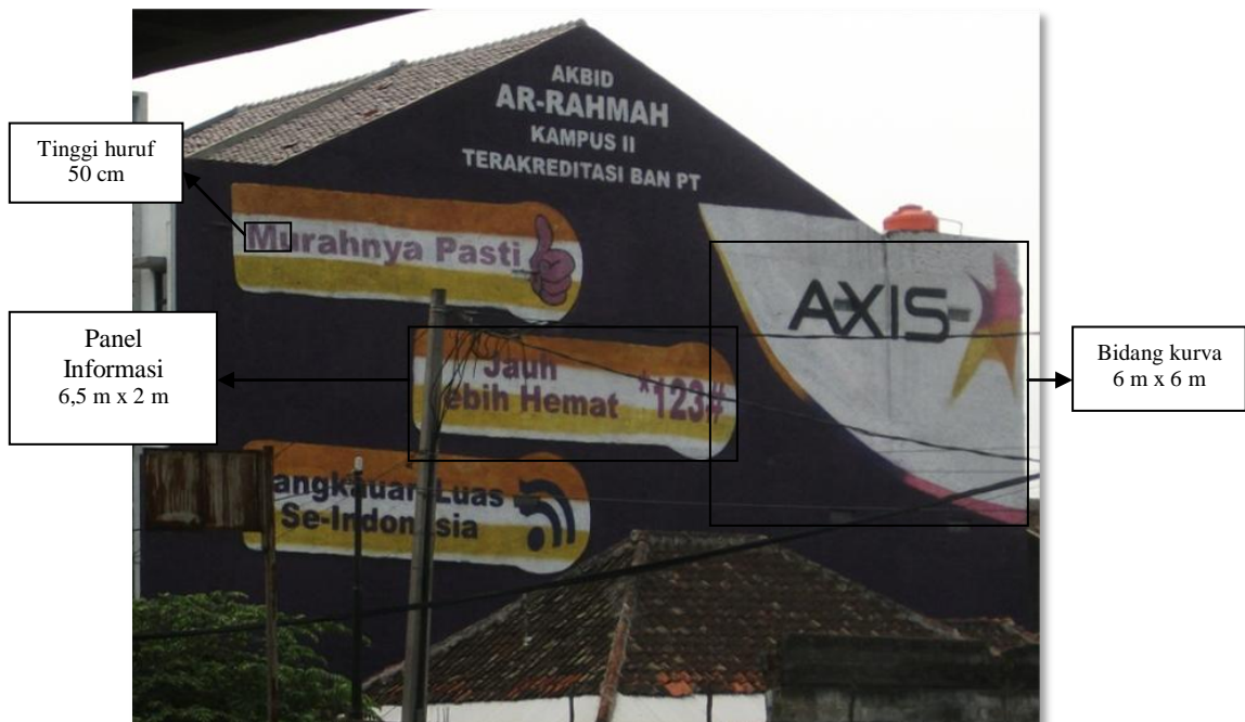
Gambar 4.27 layout Axis pada wall painting (dokumen pribadi)

Warna lainnya adalah adalah warna orange , magenta dan kuning, yang menjadi aksentuasi terhadap komposisi wall painting pada iklan Axis. Warna-warna ini berasal dari warna pada logo Axis, sehingga dapat dimanfaatkan menjadi kombinasi bidang pada komposisi wall painting . Strategi visualnya adalah agar iklan wall painting memiliki sistem grafis yang sama pada promosi produknya.