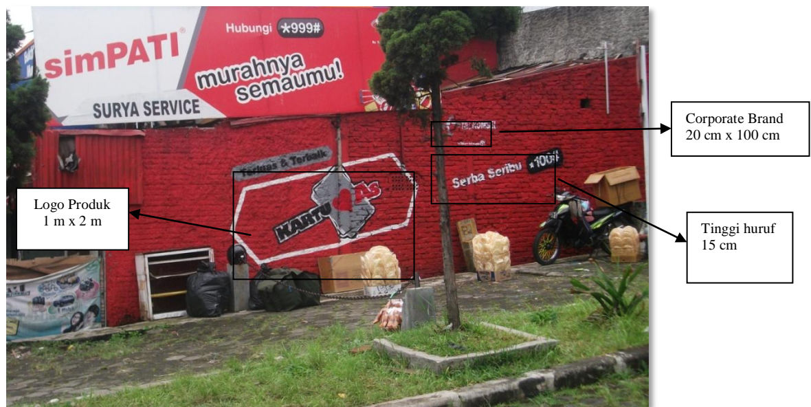
Gambar 4.15 Wall painting Kartu As ‘Serba Seribu’ (dokumen pribadi)

Produk Telkomsel ‘Kartu As’ berdasarkan pengamatan lebih mengambil segmentasi pasar bagi masyarakat yang membutuhkan pelayanan telekomunikasi yang lebih murah dan terjangkau. Selain itu merupakan langkah untuk menghadapi bentuk persaingan harga terhadap produk operator telekomunikasi lainnya. Iklan wall painting ‘Kartu As’ umumnya berada bersamaan dengan iklan wall painting produk Simpati.