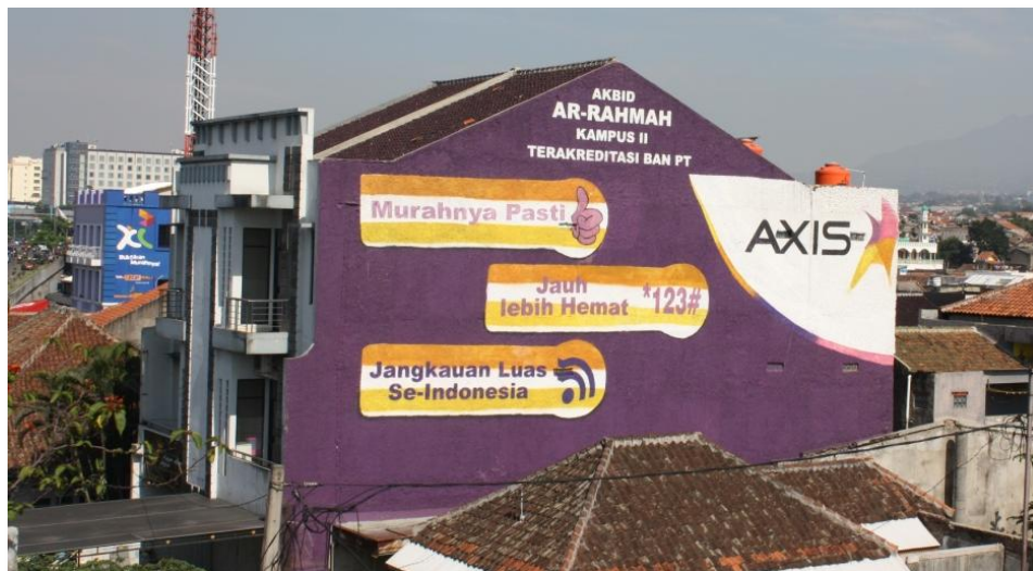
Gambar 3.11 Penerapan Wall painting brand Axis

Produk-produk Axis terhadap layanan komunikasi berfokus pada layanan selular suara dan sms, layanan data Internet, layanan budling Blackberry, dan layanan internasional. Promosi periklanan yang digunakan umumnya menggunakan media-media konvensional termasuk media nontradisional wall painting untuk melakukan penyebaran brand di Indonesia.