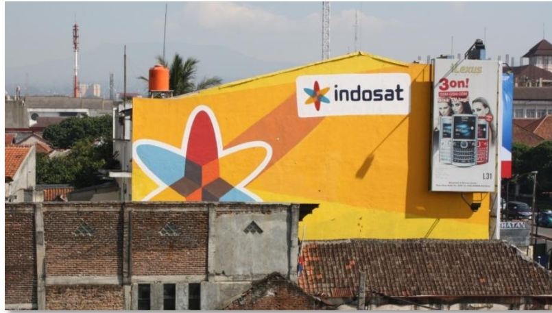
Gambar 3.9 Iklan wall painting Indosat