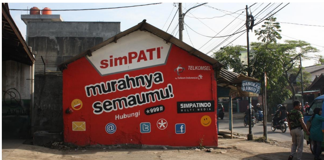
Gambar 3.5 iklan wall painting Telkomsel.

Telkomsel dalam kegiatan promosi, bundling dan branding tetap memfokuskan pada layanan inti perusahaan yaitu; Kartu As dan Simpati. Kampanye promosi pada tahun 2010 dilakukan sangat agresif, karena kedua produk tersebut menjadi pemimpin pasar. Kampanye yang dikhususkan pada tarif murah sebagai pesan kuat komunikasinya. Kampanye ini terus berlanjut termasuk salah satunya melakukan langkah kampanye dengan menggunakan wall painting .