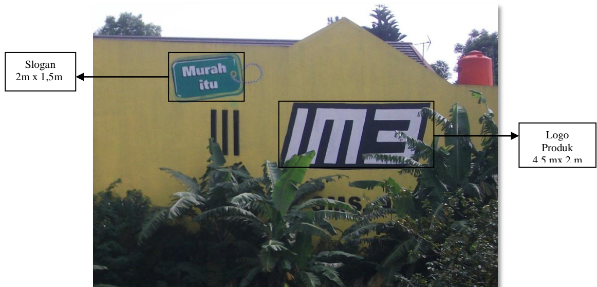
Gambar 4.22 IM3 produk Indosat pada wall painting (dokumen pribadi)

Pada produk IM3 warna yang digunakan adalah warna hitam dan hijau, dengan kombinasi warna dengan dasar kuning. Warna hitam digunakan untuk merek produk IM3, sebagai salah satu produk andalan Indosat yang menjangkau masyarakat luas. Tagline produk berupa pesan ‘murah itu’ ditulis dengan warna putih diatas modul warna hijau dalam bangun persegi empat bersudut tumpul menunjukkan penguatan pesan. Hijau meski bukan termasuk dalam warna korporasi Indosat namun merupakan bagian dari warna produk Indosat, selain hijau juga merupakan warna turunan dari warna kuning. Komposisi warna ini masih merupakan bagian dalam sistem grafis visual Indosat.