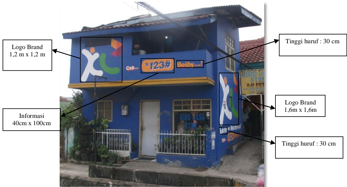
Gambar 4.16 Penerapan wall painting XL pada sebuah rumah (dokumen pribadi)

Identitas visual XL memiliki karakter yang khusus, perbedaannya terdapat pada beberapa elemen visual yang bisa langsung ditangkap oleh indera mata khalayak. Kekuatan visual yang sudah terbangun sejak awal melalui berbagai promosi perusahaan, dapat diteruskan dengan mudah melalui pendekatan media visual berupa wall painting . Keseragaman dalam elemen visual ini menjadikan XL tidak sulit dalam melakukan penerapan branding melalui beberapa aplikasi media. Pada penerapan iklan wall painting XL dilapangan khususnya di jalan Dr. Djujungan memperlihatkan terjadinya suasana persaingan antar operator-operator telekomunikasi. Situasi seperti ini memungkinkan terjadinya ‘perang pengaruh’ diantara dua iklan operator selular yang saling berebut posisi peletakan wall painting pada wilayah operasi yang sama, seperti situasi dibawah ini.