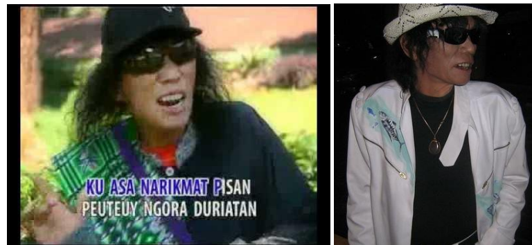
Gambar 2 Darso pada saat tampil divideoklip, Darso saat manggung di UNPAD Desember 2009.

Di sisi lain ia juga dicemooh karena caranya berpakaian yang juga melabrak pakem yang ada. Jas resmi berwarna kuning, dipadu dengan sarung yang diseledangkan ditubuhnya, sungguh desain fesyen yang mampu membuat orang terperangah.