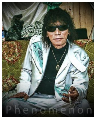
Gambar 1 Darso The Phenomenon

menjadi panutan bagi artis-artis lain yang memiliki genre musik yang sama, bahkan beberapa sumber menyatakan ia menjadi inspirasi bagi artis-artis calung lainnya. Menurut Idi Subandi (2009) mengutip dari Kees van Dijk dalam buku Outwards Appearance: Dressing State and Society in Indonesia , busana adalah salah satu dari seluruh rentang penandaan yang yang paling jelas dari penampilan luar, yang dengannya orang menempatkan diri mereka terpisah dari yang lain, dan selanjutnya, diidentifikasi sebagai suatu kelompok tertentu. Konsep Darso dalam menampilkan dirinya sebagai sebuah konsep identitas, serta pilihannya dalam gaya berbusana menjadi sebuah fenomena gaya hidup yang hadir dalam masyarakat Sunda menarik untuk diteliti, sebagai referensi bagaimana memahami gaya berbusana, fashion dari seorang Darso kaitannya dengan selera/taste serta latar belakangnya. Selain itu memahami image/citra yang dibentuk oleh konsep identitas Darso dengan atribut-atribut yang melengkapi diri darso sebagai seorang artis musik Sunda