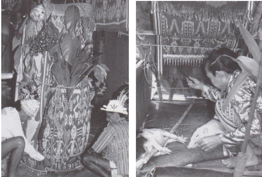
Gambar 2. Kuil sementara dan babi yang dilindungi pua kumbu dalam upacara Gawai.

Pua digunakan untuk membentuk dan menutup kuil kecil tempat babi dikorbankan. Kuil ini merupakan tempat tinggal dewa selama kelangsungan Gawai. Pua terpajang dimana-mana dan menjadi tempat untuk menyerahkan makanan pada para dewa. Gawai mencapai titik tertingginya ketika babi di sembelih dan hati babi di terawang untuk melihat pertanda. Kain terbaik dijadikan tenda diatas babi. Kain dengan pola yang kuat juga harus digunakan sebagai penerimaan hati babi diatas sebuah piring dengan tujuan mendapatkan nasib baik/keberuntungan.