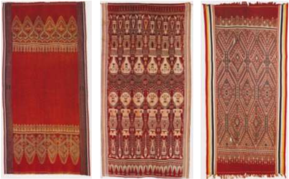
Gambar 1. Tenun Ikat Iban

dan mengumpulkan bahan lain untuk menenun, membuat tikar atau keranjang. Bagi wanita Iban, seni tenun ikat adalah suatu peninggalan yang merupakan cara utama untuk memperoleh status dan prestise .