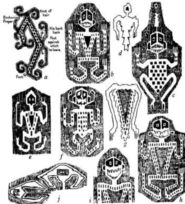
Gambar 4. Motif bentuk dewa