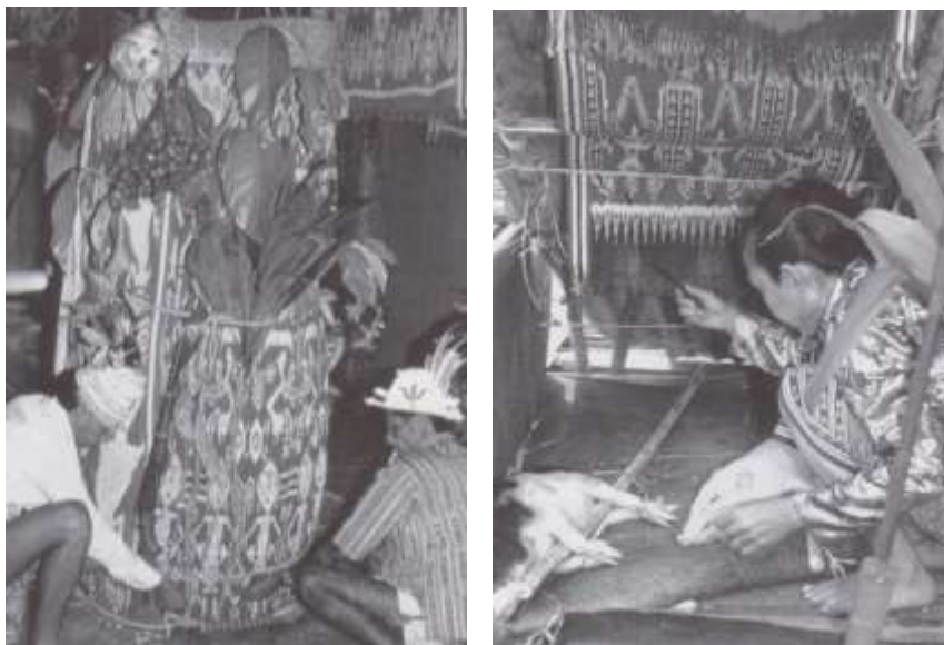
Gambar 2. Kuil sementara dan babi yang dilindungi pua kumbu dalam upacara Gawai.

Pua digunakan untuk membentuk dan menutup kuil kecil tempat babi dikorbankan. Kuil ini merupakan tempat tinggal dewa selama kelangsungan Gawai. Pua terpajang dimana-mana dan menjadi tempat untuk menyerahkan makanan pada para dewa. Gawai mencapai titik tertingginya ketika babi di sembelih dan hati babi di terawang untuk melihat pertanda. Kain terbaik dijadikan tenda diatas babi. Kain dengan pola yang kuat juga harus digunakan sebagai penerimaan hati babi diatas sebuah piring dengan tujuan mendapatkan nasib baik/keberuntungan.