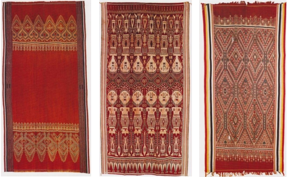
Gambar 1. Tenun Ikat Iban

dan mengumpulkan bahan lain untuk menenun, membuat tikar atau keranjang. Bagi wanita Iban, seni tenun ikat adalah suatu peninggalan yang merupakan cara utama untuk memperoleh status dan prestise .