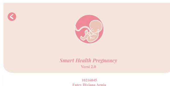
Gambar 3. Tampilan Aplikasi SmHP