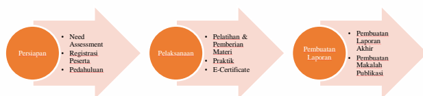
Gambar 1. Tahapan Pelaksanaan PKM

Berikut tahapan pelaksanaan PKM yang akan kami laksanakan seperti gambar di bawah ini :