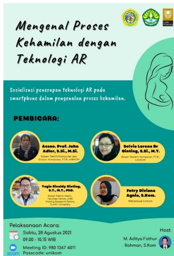
Gambar 2. Poster Kegiatan PKM

perbincangan dengan ketua RW setempat, dibutuhkan sebuah pelatihan penggunaan aplikasi nantinya via zoom meeting. Kemudian proses pembuatan poster kegiatan PKM dengan menentukan, narasumber dan host yang memimpin acara PKM.