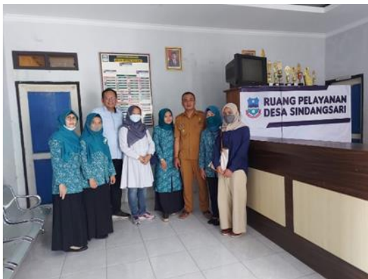
Gambar 3. Foto Kegiatan

Berikut merupakan gambar dari pelaksanaan kegiatan pengabdian dan pemberdayaan masyarakat yang telah dilakukan. Gambar tersebut terdapat pada Gambar 3.