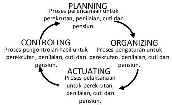
Gambar 1 Model POAC

Analisis manajemen penerimaan karyawan pada CV. XYZ ini akan digambarkan dengan menggunakan model POAC ( Planning, Organizing, Actuating, Controlling ). Tahapan model POAC pada Sistem Informasi Manajemen Penerimaan Karyawan ini akan digambarkan pada gambar berikut: