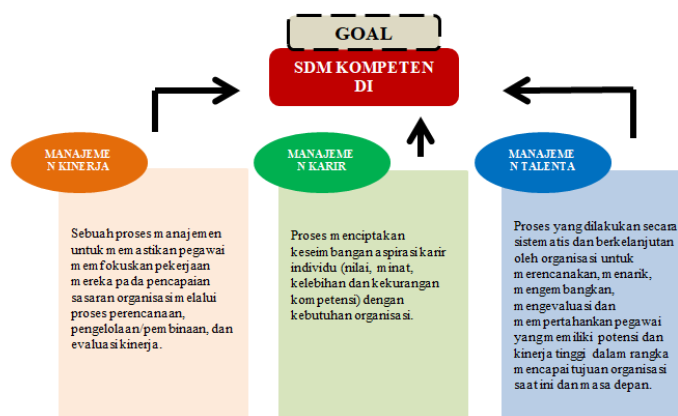
Gambar 1. Manajemen Kinerja, Manajemen Karir dan Manajemen Talenta yang berdiri masing-masing untuk pengembangan SDM di BPJS Kesehatan

Dengan melihat dinamika organisasi dan pemanfaatan sistem dalam pengelolaan kepegawaian di BPJS Kesehatan, menjadi menarik untuk dilihat secara mendalam proses strategi inovasi sistem manajemen kinerja SDM terintegrasi menggunakan big data sebagai jawaban dari tantangan pergerakan budaya yang ke arah modernisasi dan digitalisasi. Bagaimana BPJS Kesehatan sebagai salah satu organisasi pemerintah yang memiliki cukup kuat budaya birokrasi dan hambatan yang ada di dalamnya, melakukan upaya pengembangan inovasi dalam sub lini kepegawaian menjadi hal yang menarik untuk dikaji lebih dalam.