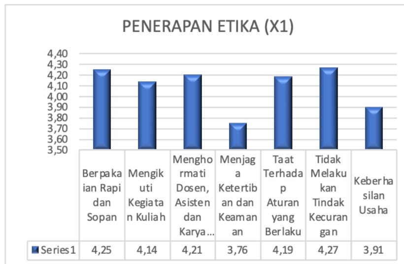
Gambar 2 Penerapan Etika

Pengukuran penerapan etika, diukur dengan menggunakan 7 (tujuh) indikator utama yang digambarkan sebagai berikut: