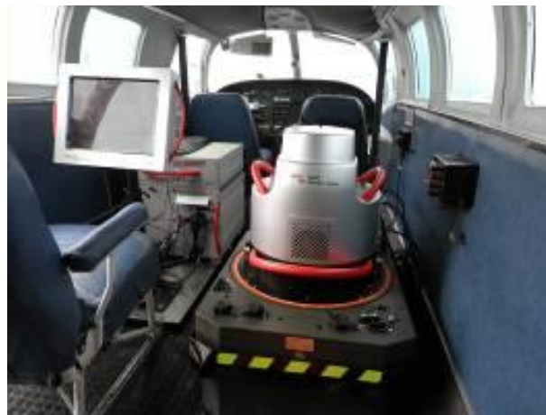
Gambar 4 Perangkat Pemotretan pada Aerial Remote Sensing [8]

Citra pada gambar 3 adalah hasil pemotretan dengan kamera khusus, berupa pesawat khusus pemotretan dan perangkat fotografi khusus untuk aerial-photo . Gambar 4 adalah ilustrasi perangkat pemotretan udara, menggunakan platform berupa pesawat terbang beserta kamera khusus.