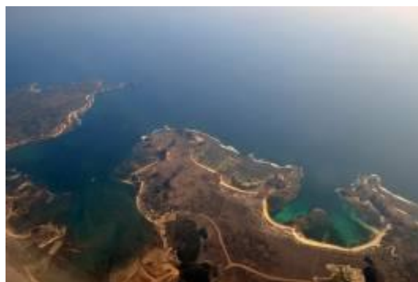
Gambar 11. Pantai Berpotensi Rawan Bencana

Gambar 11 adalah contoh hasil surveillance udara dengan sasaran pantai terbuka di pesisir selatan. Pada hasil pemotretan mengilustrasikan dataran berpasir terbuka tanpa disertai vegetasi yang cukup. Secara alamiah, lokasi Kabupaten Lombok Barat yang berposisi pada tepian pulau juga memiliki potensi natural hazard berupa tsunami . Potensi bahaya tsunami ditunjukkan dengan adanya informasi geologis serta fakta pantai yang memiliki lereng datar. Mencermati foto pada gambar 11 terlihat jelas bahwa jika terjadi tsunami maka gelombang yang masuk kurang memiliki penahan. Jika ditinjau dataran pantainya, tampak tanah lepas dan datar yang kurang memiliki daya redam.