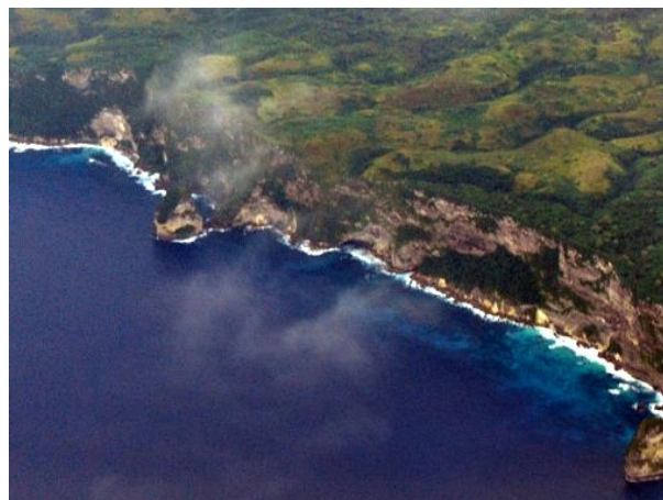
Gambar 13. Pantai Berpotensi Terabrasi

Wilayah Kabupaten Lombok Barat juga memiliki potensi natural hazard yang lain, yaitu abrasi pada wilayah pantai. Dataran yang secara langsung berhadapan dengan laut lepas memiliki potensi abrasi. Gambar 13 mengilustrasikan kawasan yang memiliki potensi natural hazard karena abrasi. Dalam gambar 13 tampak sekali garis pantai yang langsung berupa perbukitan dan mendapatkan benturan kuat dari gelombang laut. Obyek berwarna putih memanjang, dengan perbandingan ukuran yang cukup besar jika dibanding dengan ketinggian dan ukuran bukit sisi di atasnya. Memperhatikan perbandingan tersebut, dapat diasumsikan bahwa benturan gelombang laut ke daratan cukup besar.