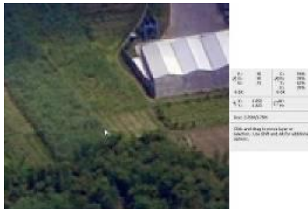
Gambar 15. Nilai Digital Vegetasi Foto Hasil Pemotretan Kamera dengan Sensor APS-C

Hasil pemotretan kamera dengan sensor APS-C tetap diproses menggunakan teknik pemrosesan foto udara secara umum dan metode pada gambar 8. Koreksi atmosferik secara prinsip diterapkan untuk mendapatkan citra yang lebih clear dan efek gangguan haze tereduksi. Langkah kedua adalah penajaman citra, memanfaatkan program aplikasi yang bersesuaian untuk foto hasil pemotretan memanfaatkan kamera dengan sensor APS-C. Gambar 15 adalah potongan bagian ( crop ) tertentu berdasar pada gambar 14. Sebagai bahan analisis kesesuaian memilih obyek yang sama dengan referensi pada gambar 6, yaitu obyek vegetasi atau tumbuhan.