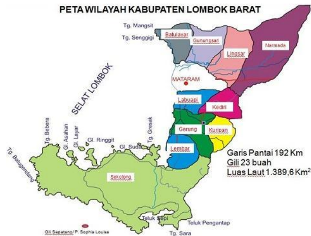
Gambar.1 Peta Kabupaten Lombok Barat [2]

Pesisir wilayah selatan Kabupaten Lombok Barat berhadapan langsung dengan samudera Hindia dan berada di tepian lempeng benua. Tanda kotak dalam gambar 2 adalah posisi lokasi Kabupaten Lombok Barat berada terhadap pulau Lombok.