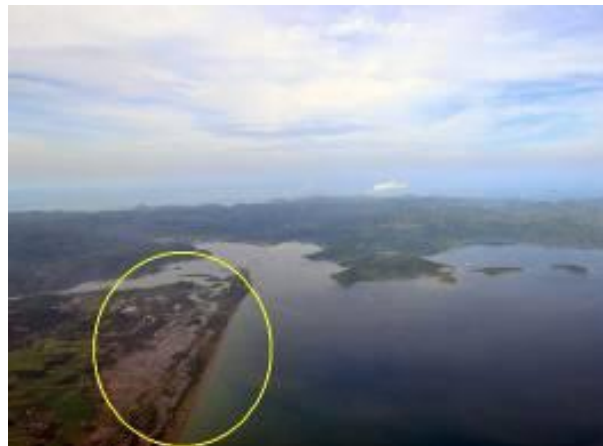
Gambar 12. Pantai Berpotensi Bencana Rob

Potensi natural hazard lain yang dimungkinkan adalah rob, genangan atau aliran banjir yang berasal dari arah laut ke daratan dan aliran air tidak mudah kembali kearah laut. Potensi rob juga seperti terilustrasikan pada gambar 12. Struktur pantai pada gambar 12 menunjukkan terdapat area berpotensi genangan yang airnya berasal dari laut. Tanda lingkaran pada gambar 12 menunjukkan obyek lokasi yang memiliki potensi rob. Pada gambar tersebut terindikasi bahwa kawasan tersebut merupakan dataran rendah yang memiliki ketinggian lebih rendah dari pantai. Keadaan tersebut ditambah berada pada aliran air dari arah laut maupun dari arah daratan sisi dalam.