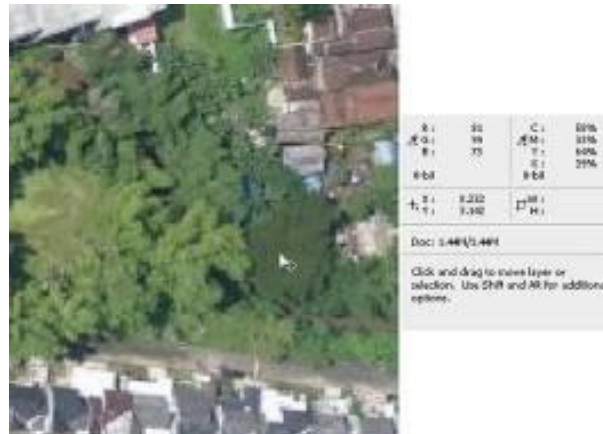
Gambar 6. DN-value Obyek Vegetasi pada Citra [10]

nilai digital obyek tertera dengan kombinasi 81-99-73. Angka kombinasi setipe atau yang tidak jauh berbeda dengan nilai tersebut dapat diasumsikan bahwa obyek tersebut sekategori, yaitu vegetasi.