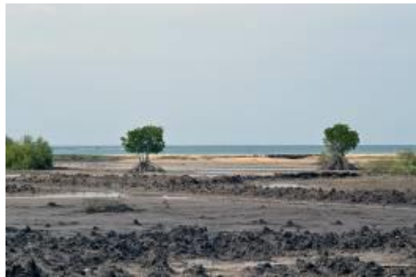
Gambar 10. Pantai Terbuka, Pemotretan Terrestrial

Berdasar referensi, kawasan Kabupaten Lombok Barat teridentifikasi memiliki beberapa potensi bencana alam. Potensi yang dimungkinkan tersebut antara lain rob, tsunami , landslide , abrasi. Potensi tersebut merupakan tambahan disamping potensi yang telah dimiliki secara geologis, seperti terurai pada bagian I dan gambar 2. Pemotretan surveillance mengaplikasikan pemotretan udara dan terrestrial menggunakan kamera dengan sensor APS-C, sesuai dengan metodologi pada gambar 8. Berikut ini adalah foto hasil penelusuran ke lokasi obyek data, dengan referensi data spasial yang telah tersedia pada SIGDa Lombok Barat. Pemanfaatan data spasial yang telah tersedia pada SIGDa Lombok Barat bertujuan sebagai pemandu lokasi pelaksanaan surveillance . Gambar 10 berikut adalah citra hasil surveillance pemotretan secara terrestrial . Gambar 10 adalah lokasi yang menunjukkan memiliki potensi bencana karena kurang adanya pengelolaan kondisi lingkungan. Bakau yang tersedia tidak terawat dan tidak ada penambahan. Pandangan di pantai menunjukkan langsung berhadapan pada laut lepas. Temuan lain diperoleh terhadap potensi natural hazard lainnya.