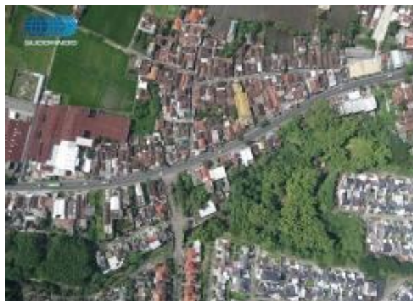
Gambar 5. Citra Foto Udara Referensi [10]

Kebenaran menangkap obyek di muka bumi pada aerial-photo dapat dinyatakan pada hasil uji kesesuaian pixel yang diwakili dengan kode nilai digital ( digital number value / DN-value ) pada citra. DN-value pada citra aerial-photo dengan kamera khusus aerial-photo dapat dipergunakan sebagai referensi terhadap kamera lainnya [10]. Gambar 5 adalah citra referensi yang diperoleh berdasar pemotretan menggunakan kamera aerial-photo yang khusus untuk itu [10].