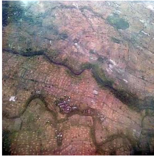
Gambar 3 Citra aerial-photo di Pulau Lombok [7]

Citra pada gambar 3 adalah hasil pemotretan dengan kamera khusus, berupa pesawat khusus pemotretan dan perangkat fotografi khusus untuk aerial-photo . Gambar 4 adalah ilustrasi perangkat pemotretan udara, menggunakan platform berupa pesawat terbang beserta kamera khusus.