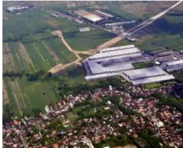
Gambar 14. Citra Foto Udara Kamera dengan Sensor APS-C

dengan gambar 11, gambar 12 dan gambar 13. Secara dasar, foto udara hasil pemotretan kamera dengan sensor APS-C telah dilakukan pre-processing sebelum dilakukan interpretasi. Interpretasi dipergunakan sebagai bagian penting dalam memenuhi kebutuhan identifikasi potensi foto udara hasil pemotretan kamera dengan sensor APS-C.