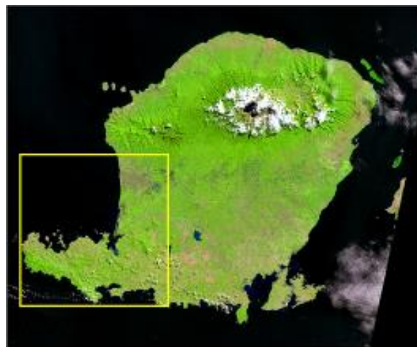
Gambar 2 Citra Satelit Pulau Lombok [4]

Pesisir wilayah selatan Kabupaten Lombok Barat berhadapan langsung dengan samudera Hindia dan berada di tepian lempeng benua. Tanda kotak dalam gambar 2 adalah posisi lokasi Kabupaten Lombok Barat berada terhadap pulau Lombok.