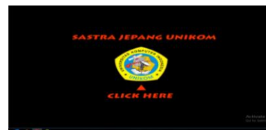
Gambar 3 Tampilan Awal

tampilan awal adalah tampilan pertama kali yang dilihat oleh pengguna dalam menggunakan aplikasi ini, klik dua kali pada logo maka akan masuk ke menu utama.