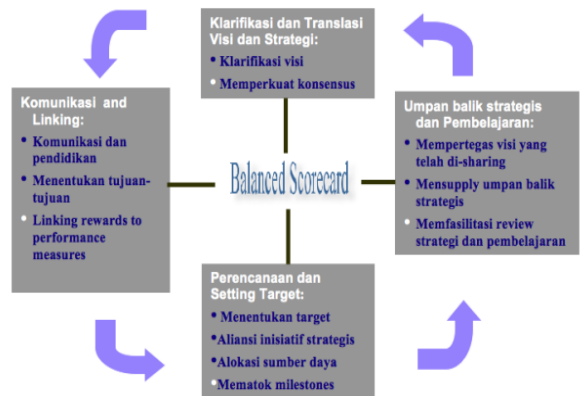
Gambar 1. Kerangka Balance Scorecard

manajemen yang telah terbukti telah membantu banyak perusahaan dalam mengimplementasikan strategi bisnisnya. Gambar 1 menunjukkan kerangka Balance Scorecard secara umum.