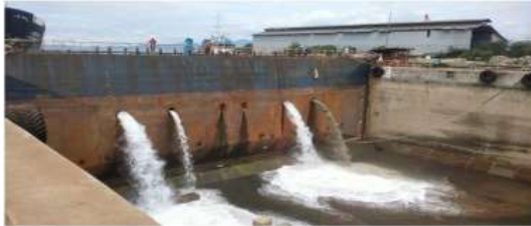
Gambar 5. Pengisian kembali kolam graving dock

Pengisian kembali kolam graving dock terdapat pada gambar 5.