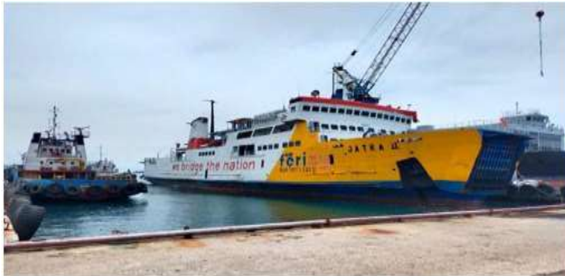
Gambar 2. Kapal ASDP saat sandar di dermaga

Rencana umum ( general arrangement ) reparasi kapal terdapat pada gambar 3.