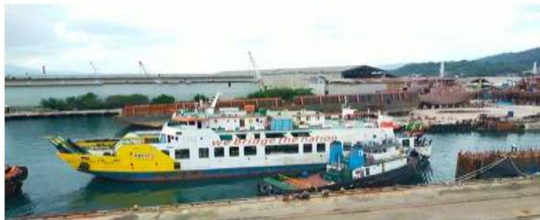
Gambar 6. Proses Shifting kapal dari alur ke dalam graving dock

Kapal yang akan direparasi memasuki area graving dock terdapat pada gambar 6.