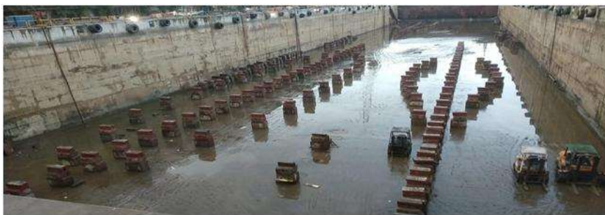
Gambar 4. Proses penyusunan keel block

Pengaturan keel block pada dock terdapat pada gambar 4.