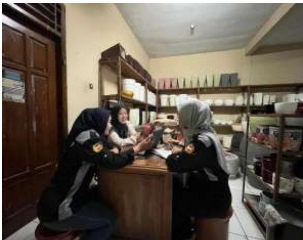
Gambar 3. Kegiatan Pengabdian di Toko Cupu Manik