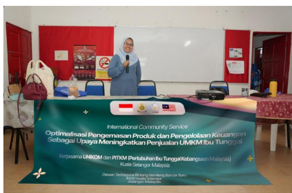
Gambar 3. Kegiatan PKM