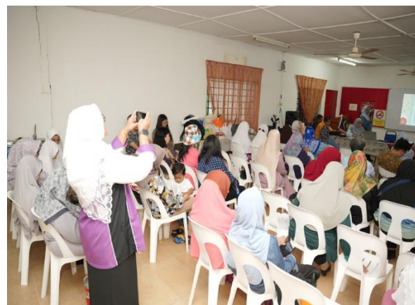
Gambar 4. Kegiatan Pre test