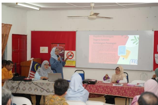
Gambar 2. Kegiatan PkM