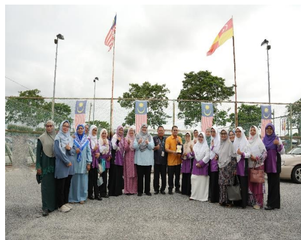
Gambar 5. Narasumber dan Peserta