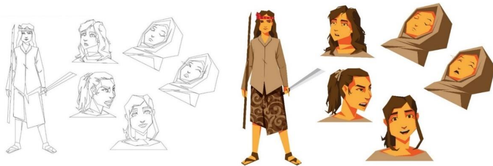
Gambar 7. Ilustrasi Sektsa dan Digital Karakter Martha Sumber: Dokumentasi Pribadi (2022)