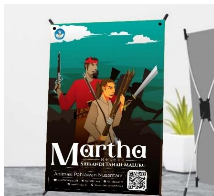
Gambar 14. Mockup Mini Banner

Mini banner ini sebagai media promosi dan publikasi yang berfungsi memuat informasi tentang perilsan perancangan animasi 2D. Konsep mini banner lebih menerapkan penampilan karakter Martha Khristina Tiahahu yang menawan serta berani. Desain pada poster ini juga menggunakan gaya flat design . Seperti pada tujuan perancangan ini yaitu mengenai kisah perjuangan dari Srikandi Martha Khristina Tiahahu.