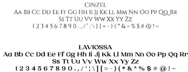
Gambar 5. Jenis Font

Huruf yang digunakan oleh praktikan dalam sebuah karya desain kali ini menggunakan jenis huruf Serif, yaitu huruf Cinzel, Laviossa, karena memiliki ketegasan dan kejelasan untuk dibaca bahkan hanya dalam seatu kali melihat. Selain keutamaan tersebut font ini dipilih dikarenakan memiliki karakter yang sesuai dengan tema sejarah.