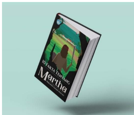
Gambar 12. Mockup Booklet

Desain pada booklet ini yang berjudul “10 Fakta Martha; Srikandi Tanah Maluku” ini menampilkan berbagai ilustrasi yang terdapat pada Animasi 2D serta memuat konten mengenai fakta dari Martha Khristina Tiahahu. Pada ilustrasi didalam booklet tetap mengambil gaya flat design . Booklet ini akan memudahkan penyebaran mengenai perancangan Animasi 2D ini.