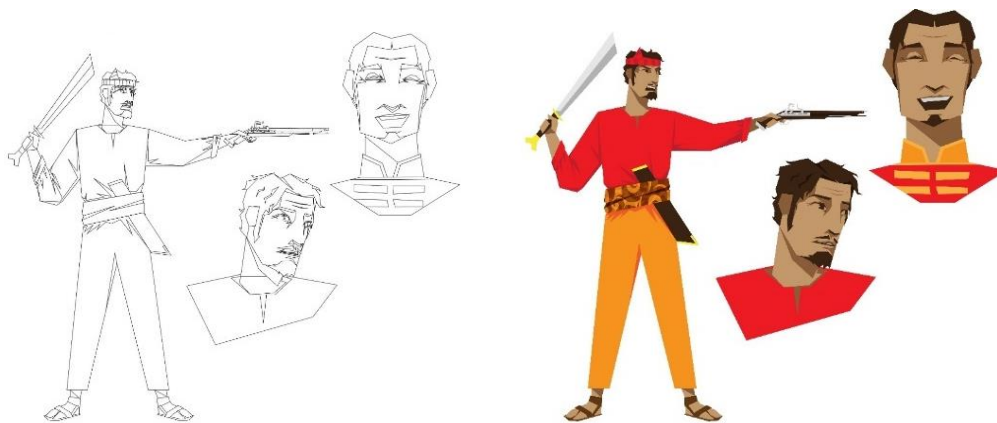
Gambar 8. Ilustrasi Sektsa dan Digital Karakter Kapitan Paulus Tiahahu