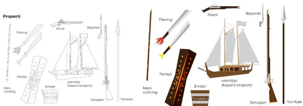
Gambar 9. Ilustrasi Sektsa dan Digital Properti