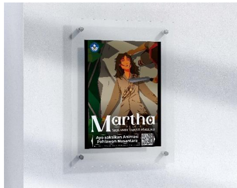
Gambar 13. Mockup Poster Digital/Cetak

Poster ini akan digunakan sebagai media pendukung untuk memberikan informasi seputar Martha Khristina Tiahahu kepada target audience . Desain pada poster ini juga menggunakan gaya flat design , konsep pada poster ini dibuat lebih simple dengan judul dan karakter yang terlihat jelas yang menampilkan media attention dan interest yang nantinya berisi ilustrasi gambaran Martha Khristina Tiahahu, ataupun gambaran bersama dengan sang Kapitan Paulus.