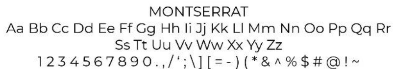
Gambar 6. Jenis Font

Montserrat adalah salah satu jenis font sans series yang juga cocok digunakan untuk body text, atau subtitle pada video. Jika dilihat font ini sangat simple, modern dan sesuai dengan gaya desain yang dibuat pada bagian tema maupun konsepnya dan menjadikan penulisan dalam penggunaan desain akan sangat nyaman dilihat, dan mudah dibaca dengan baik.