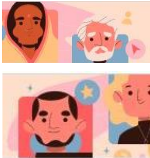
Gambar 3. Referensi Ilustrasi Flat Design

bergaya konsep ilustrasi flat design . Flat Design , yaitu sebuah jenis desain yang mempunyai sifat minimalis. Ilustrasi flat design mempunyai khas pada penggunaan warna cerah, gambaran ilustrasinya yang geometris atau fleksibel, hingga berbentuk dua dimensi (Hasanuddin & Adityawan, 2021).