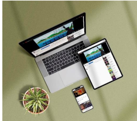
Gambar 11. Mockup Screen Tampilan Animasi 2D Pada Gadget