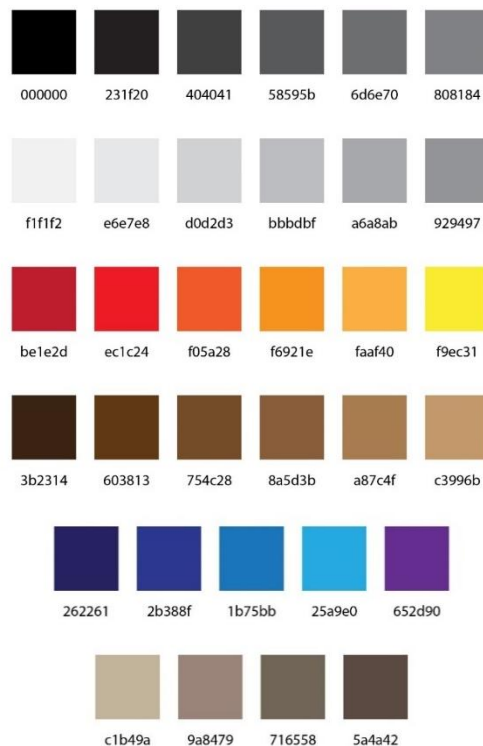
Gambar 10. Warna

Pemilihan warna yang tepat dapat membuat sebuah perancangan tampak lebih hidup dan lebih menarik untuk diamati, dan memudahkan untuk diingat. Penggunaan warna dalam pembuatan perancangan kali ini merupakan aspek yang harus diperhatikan agar sesuai dengan lingkungan disekitarnya (Pracihara, 2016). Warna yang dipilih harus berhubungan dengan konsep sebelumnya. Penggunaan warna dipilih karena sesuai dengan konsep flat design yang simpel dan elegant .