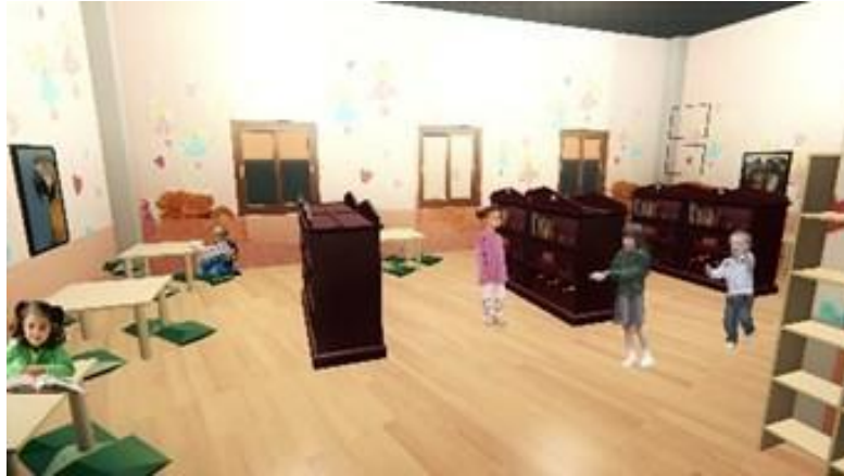
Gambar 6. Ruang Baca

Ruang baca merupakan salah satu ruang yang ada karena tema yang telah diterapkan yaitu sesuai dengan makna tema yang diambil yaitu kegemaran. Warna yang terlihat dan diterapkan pada ruang baca adalah warna yang mampu menimbulkan rasa aman, nyaman, serta tenang karena fungsi ruang yang merupakan ruang untuk membaca. Warna yang diterapkan yaitu warna coklat karena warna coklat memiliki kesan aman, nyaman serta menikmati selama berada pada ruang baca (Gambar 6).