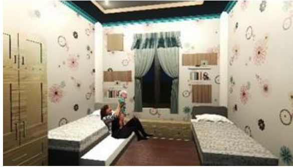
Gambar 7. Ruang Tidur Asrama

Tanpa melupakan kebutuhan untuk anak penderita kanker dimana terdapat Kasur tidur yang tidak bertingkat dan menggunakan Kasur yang bias dilipat agar anak dapat dekat dengan orang tua sehingga memberikan kemudahan mereka sehingga kenyamanan dan kemudahan dalam berkegiatan dapat tercapai (Gambar 7).