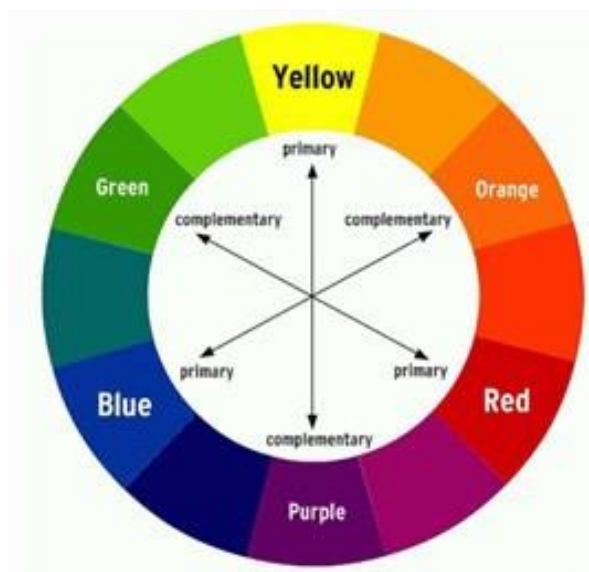
Gambar 2. Kelompok Warna

Pengertian psikologis warna menurut para ahli fisiologi dan psikologi merupakan arti, sifat dan pengaruh yang ada dalam suatu warna bagi yang menggunakan. Berikut beberapa warna yang mempengaruhi psikologis anak yaitu :