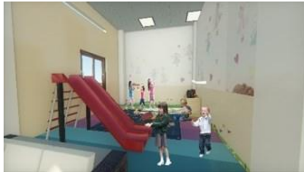
Gambar 8. Ruang Bermain

Ruang bermain merupakan salah satu ruang yang ada karena tema yang telah diterapkan yaitu sesuai dengan pengaruh keceriaan anak. Warna yang terlihat dan diterapkan pada ruang bermain adalah warna yang mampu menimbulkan rasa aman dan nyaman serta menimbulkan rasa tenang dengan menerapkan warna biru, krem dan ungu yang menambah kesan kegembiraan (Gambar 8).