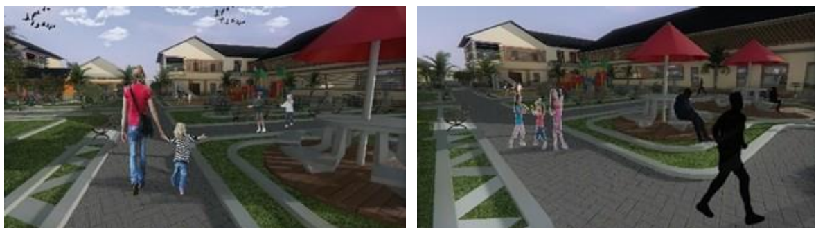
Gambar 4. Eksterior suasana Taman Paliatif dan Taman Bermain

Taman paliatif dan taman bermain outdoor yang merupakan salah satu konsep penerapan tema yang dipilih dalam proses perancangan (Gambar 4). Fungsi- fungsi fasilitas tersebut adalah taman paliatif yang berfungsi sebagai penyembuhan dan terapi bagi anak penderita kanker serta mengurangi rasa sakit secara fisik maupun psikis Dan juga berfungsi sebagai tempat beraktivitas untuk penderita kanker pada anak dan keluarga belajar berkebun. Taman Paliatif ini, dirancang khusus untuk penderita kanker pada anak yang memerlukan ruang terbuka hijau dan ruang bermain. Tujuannya, untuk mengurangi rasa sakit, baik fisik maupun psikis penderita kanker pada anak serta agar anak penderita kanker dapat memiliki keceriaan.