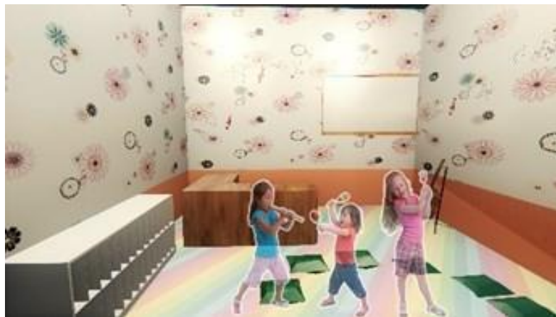
Gambar 5. Ruang Terapi Musik

Dari penerapan konsep pada rancangan dari salah satu penjabaran makna cheerful environment yaitu Love to memiliki arti kegembiraan atau kesukaan yang memiliki arti kesukaan kesenangan atau juga disebut dengan hobi. Kesukaan seseorang terhadap sesuatu yang bisa dipengaruhi banyak hal, bisa karena pengaruh didikan semasa kecil, kenangan indah dengan sesuatu sangat berbakat dalam bidang tersebut, dan lain-lain. Melalui hobi, anak-anak boleh melakukan sesuatu atas dasar "bersenang-senang" yang dapat mengalihkan rasa takut, gelisah anak penderita kanker. Hal itu pula akan memberikan banyak manfaat untuk kebahagiaan pada jiwa anak penderita kanker. Maka terbentuk ruang dalam berupa ruang yang menampung hobi anak penderita kanker yaitu ruang musik. Ruang musik ini bukan hanya berfungsi untuk menyalurkan hobi mereka, melainkan dapat menjadi faktor healing dan terapi untuk anak penderita kanker pada saat proses penyembuhan. Berikut di bawah ini merupakan suasana dalam ruang musik yang ada pada rancangan. Warna yang diterapkan pada ruang terapi musik dengan pengaplikasian makna dari tema yang senang, tenang, bergairah dan sehat. Dari warna yang diaplikasikan pada ruang dalam ada beberapa warna yang mendominasi yaitu warna cerah seperti warna biru, merah muda, hijau yang diterapkan pada lantai dan dinding (Gambar 5).