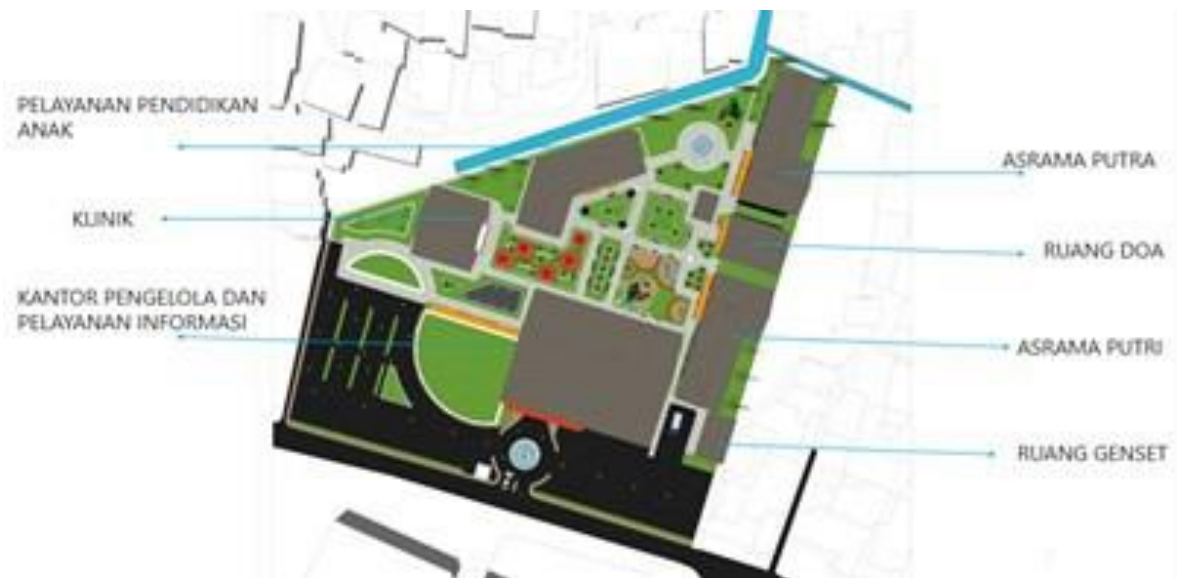
Gambar 3. Pengolahan Tata Massa

Gambar 3 merupakan gambaran tatanan massa di mana fasilitas memiliki fasilitas Kantor Pengelola dan Pelayanan Informasi, Pelayanan Pendidikan Anak, Klinik, Asrama Putra, Asrama Putri, Ruang Doa dan Genset.