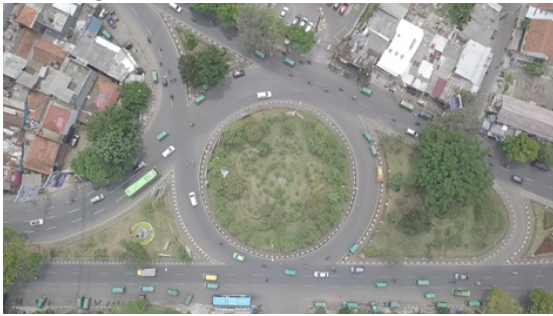
Gambar. 1 Lokasi Penelitian

menghubungkan Jalan Cibiru (A), Jalan A.H. Nasution (C), dan Jalan Soekarno – Hatta (B), Cibiru, Kota Bandung, Jawa Barat, Indonesia.