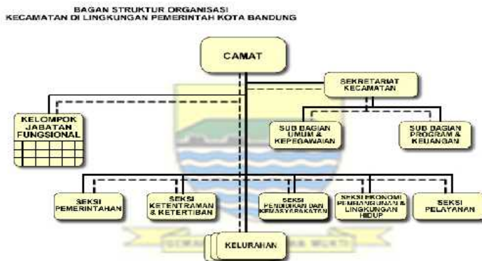
Gambar Struktur Organisasi Kecamatan