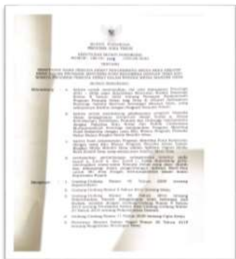
Gambar 4. Surat Keputusan Bupati Ponorogo