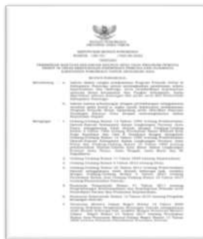
Gambar 1. Surat Keputusan Bupati Ponorogo

Kondisi awal merupakan awal proses terjadinya fenomena atau pengaruh adanya proses kolaborasi yang menyebabkan para stakeholder mempunyai target yang akan dicapai bersama-sama. Kondisi awal ini sebagai pemicu terjadinya keinginan para pihak yang terlibat untuk melakukan kolaborasi baik itu dari pemerintah dan lembaga lainnya (Ridwan & Hartono, 2023).