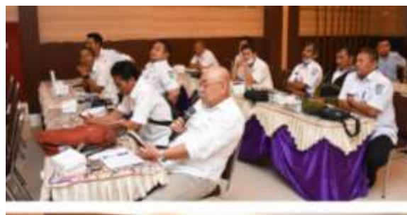
Gambar 3. Focus Group Discussion (FGD) Pelaksanaan Program Pemuda Hebat

Berdasarkan hal tersebut, aktor pemerintah dengan akademisi, melakukan upaya awal dalam membangun kepercayaan diantara aktor yang ada. Ansell dan Gash (2007) menjelaskan bahwa membangun kepercayaan antar pihak yang terlibat di tengah keterbatasan kapasitas dan perbedaan antar stakeholders . Keterbatasan dan perbedaan tersebut yang dapat dijadikan salah satu dorongan untuk dapat membangun kepercayaan diantara aktor.