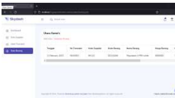
Gambar 3. Tabel Barang

Mengirim pemberitahuan kepada pihak yang terkait: Setelah barang yang masuk diterima, dicatat, dan disimpan, selanjutnya adalah mengirim pemberitahuan kepada pihak yang terkait. Ini bisa berupa pemberitahuan kepada bagian pembelian atau bagian keuangan untuk mengupdate stok barang atau mencatat transaksi pembelian.