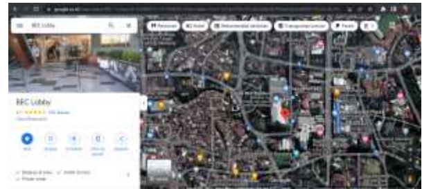
Gambar 1. Lokasi Toko Utara Game di BEC Bandung.

Dalam pengumpulan data penulis menggunakan metode wawancara langsung terhadap beberapa aparat yang terkait di Toko Utara Game.