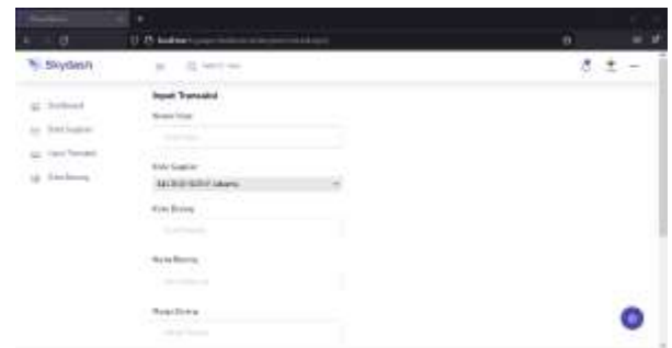
Gambar 4. Form Input Transaksi

Prosedur pencatatan barang masuk harus dilakukan dengan teliti dan benar untuk memastikan bahwa semua barang yang masuk dapat dilacak dan dipertanggungjawabkan dengan mudah.