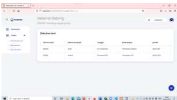
Gambar 2. Tabel Kas Kecil.

Aplikasi Buku Kas Kecil terdiri atas tiga modul yaitu modul kas kecil, modul pengeluaran, dan modul karyawan. Modul kas kecil menunjukkan tabel kas kecil dari table pengeluaran terlihat pada gambar 2. Sedangkan modul pengeluaran menunjukkan tabel data dari bukti transaksi terlihat pada gambar 3 dan modul karyawan menunjukkan tabel data karyawan terlihat pada gambar 4.