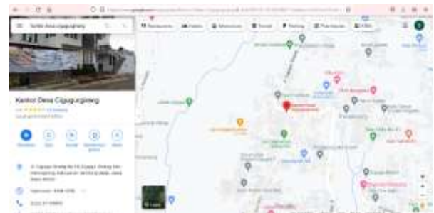
Gambar 1. Lokasi PAMDES Tirta Wangi Cigugur Girang.

Dalam pengumpulan data penulis menggunakan metode wawancara langsung terhadap beberapa aparat yang terkait di PAMDES Tirta Wangi.