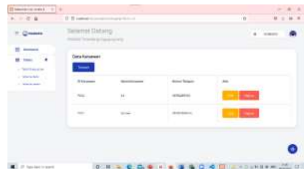
Gambar 4. Tabel Karyawan.