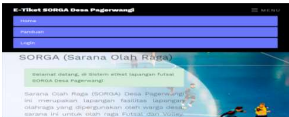
Gambar 2 Bagian fitur menu pada Aplikasi E-TIKET SORGA.

pemesanan lapangan futsal (hari dan jam) selanjutnya dilakukan pembayaran uang muka pemasan lapangan. Untuk pelunasan dapat dilakukan di lapangan futsal pada hari dan jam yang telah dipesan sebelumnya oleh customer. E-ticketet SORGA merupakan aplikasi pemesanan ticket lapangan olah raga berbasis WEB yang dapat diakses melalui alamat: http://etiket.smartassetsbusiness.com , yang dirancang dengan sederhana sehingga cukup mudah digunakan untuk mengakomodir pengolahan transaksi pemesana tiket dengan lebih efektif dan efisien. Fitur/menu yang tersedia dalam aplikasi tersebut terdiri dari: registrasi dan Profile, Login, Cek jadwal, Isi Form Pesanan, Upload Bukti Bayar dan Cek Bukti/Ticket. Sebagian Tampilan Fitur/menu pada Aplikasi E-Ticket SORGA dapat dilihat berikut ini: