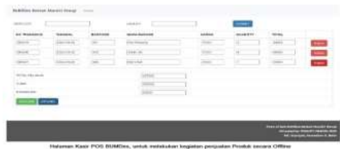
Gambar 4 Aplikasi POS (Point Of Sale) atau Aplikasi Kasir untuk BUMDes Berkah Mandiri Wangi

Selanjutnya untuk mengoptimalkan penggunaan Aplikasi-aplikasi tersebut, TIM pelaksana PPMUPT UNIKOM telah melakukan kegiatan dan pendampingan Launching Program dan Pelatihan Penggunaan Aplikasi Kegiatan ini dilaksanakan dalam kurun waktu Bulan Agustus sd Awal November 2020 dengan melibatkan banyak pihak, mulai dari kepala Desa, ketua BUMDes, Pelaku Usaha UMKM atau Industri Rumah