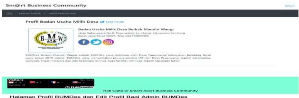
Gambar 1 Tampilan Aplikasi Smart Asset Business PPMUPT UNIKOM

Smart Asset Business adalah aplikasi berbasis Website yang dibuat oleh Tim Peneliti dan Tim Pelaksana dari Program Pemberdayaan Masyarakat Unggulan Perguruan Tinggi (PPMUPT) Universitas Komputer Indonesia pada tahun 2013 sd 2014, yang digunakan oleh Entitas UKM dan BUMDes dalam mengelola Asset Perusahaan, Pengambilan keputusan pimpinan agar tetap sustainable di dalam pengelolaan usahanya, selain itu Smart Asset Business dapat mencatat transaksi Penjualan secara Online maupun offline untuk menghasilkan Laporan Perhitungan Asset dan Laporan Keuangan yang dapat dijadikan acuan dalam pengambilan keputusan pimpinan dan pemangku kepentingan. Berikut adalah link website dari Smart Asset Business http://smartassetsbusiness.com/ . dan di bawah ini adalah fitur menu secara umum mengenai Smart Asset Business nya: